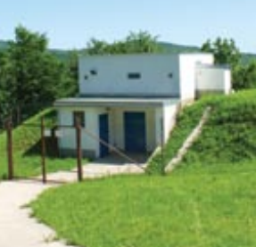
↑ Vodojem ↓ Chata Roztoky