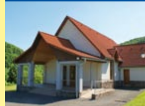
↑ Dom smútku ↓ Interiér domu smútku