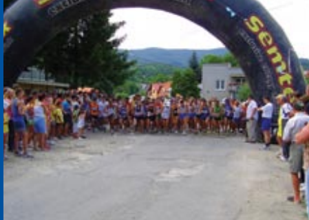
↑ Bančanská desiatka

organizujú okresnú súťažnú prehliadku folklórnych skupín a spevákov ľudových piesní – Roztoky. V obci sa konal aj 2. ročník súťaže pilčikov a 1. ročník súťaže vo varení „holubkov“.