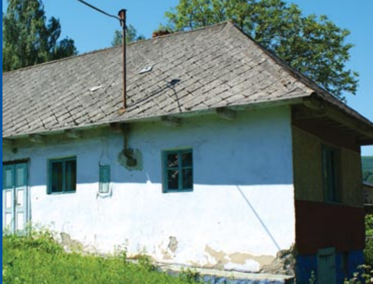
↑ Stará architektúra v obci