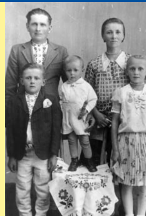
↑ Rodinná fotografia ↓ Najväčší gazda so synmi

V poslednej tretine 19. storočia patrilo Banské, v rámci humenského okresu, do obvodu rozsiahleho notárskeho úradu so sídlom v Čemernom (dnes miestna časť Vranova). Čemerniansky notár sa zúčastňoval aj na zasadnutiach bančanskej samosprávy (notár, resp. podnotár totiž zastupoval štátnu administratívu vo vedení obcí v obvode, viedol aj písomné