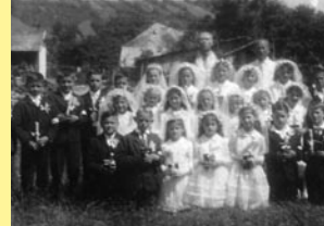
↑ Prvé sv. prijímanie (1966) ↓ Ikonostas

Na základe oficiálneho evidenčného súpisu z roku 1924 vieme, že v tom čase mali domovskú príslušnosť v obci aj Rómovia. Samozrejme, v obci sa usadili už oveľa skôr. Na základe spomienok je pravdepodobne, že prvé rómske rodiny do Banského prišli po prvej svetovej vojne. Členovia týchto rodín sa živili ako obecní pastieri. V roku 1972 v Banskom bývalo 92 Rómov a v súčasnosti je ich k trvalému pobytu prihlásených 665.