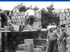
↓ Výstavba kult. domu

agendy jednotlivých dedín – vyhotovoval napr. zápisnice zo zasadnutí). Od 1. októbra 1895 pribudla notárovi ďalšia povinnosť – zabezpečiť vedenie štátnej (rodnej, sobášnej a úmrtnej) matriky (dovtedy sa totiž viedli – na príslušných farských úradoch – len cirkevné matriky, štátne matriky neexistovali).