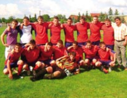
↑ Futbalový klub