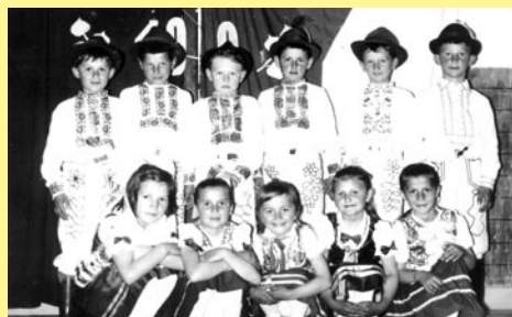
← Vystúpenie žiakov na dedinských slávnostiach