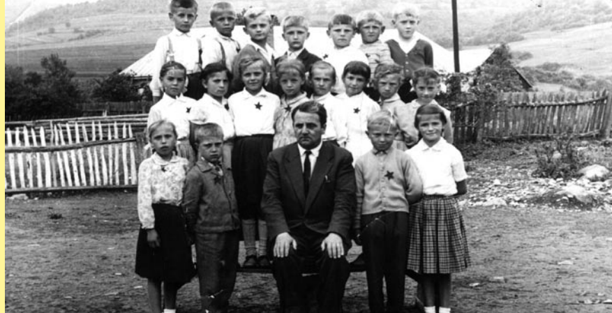
↑ Žiaci 1. ročníka v roku 1960/61