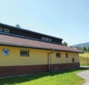
↑ ČOV ↓ Výstavba obecného vodovodu