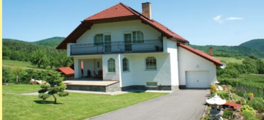
↑ Nová architektúra v obci