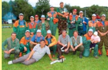
↑ Účastníci 1. ročníka Drevorubač 2010

Dôležitú úlohu v živote obce zohrávali aj miestne štruktúry rôznych spolkov, spoločenských či záujmových organizácií. Uhorskú tradíciu majú cirkevné spolky viazané na Banské ako farskú obec. K najstarším svetským spolkom patrí Dobrovoľný hasičský zbor. Po roku 1948 v obci založili miestne organizácie Československého zväzu